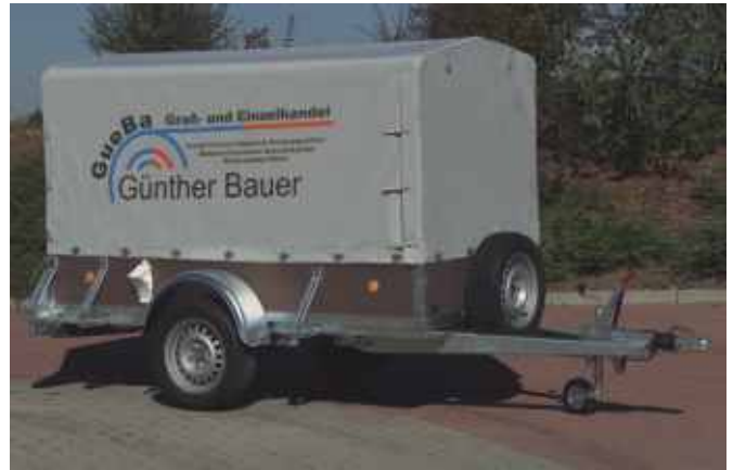
PK 1351 mit Zubehör: Ersatzrad mit Halterung, Dachgestell und PVC-Plane, die Gurtleiste wird von der Plane überdeckt und kann für Transportbefestigung benutzt werden.