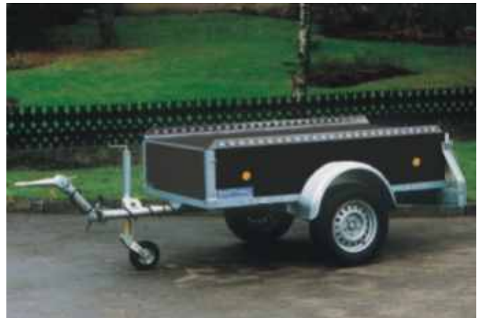
PK 751 mit Zubehör: höhenverstellbare Zugdeichsel mit LKW-DIN-Zugöse, schweres automatisch umklappbares Stützrad. Gurtleiste serienmäßig.