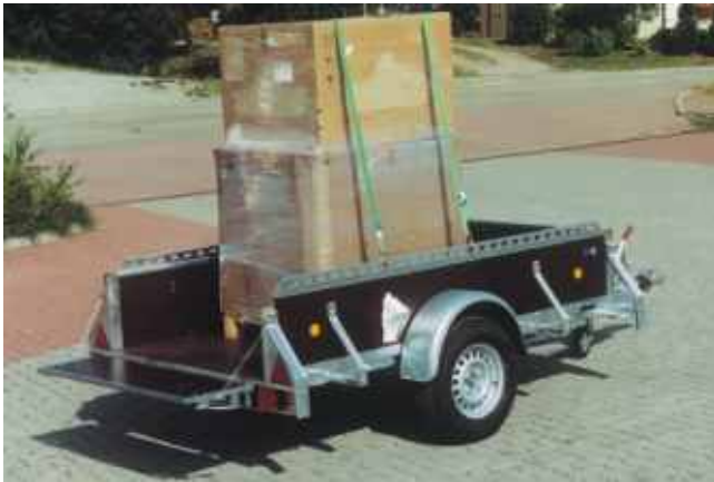
PK 1351 mit Gurtleisten auf den seitlichen Bordwänden oben angebracht zum Einhängen von Zurrgurten.