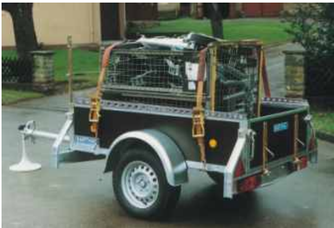
PK 751 mit Zubehör: H-Galerie kombiniert mit Gurtleiste. Praktisch: Die serienmäßig am Rahmen angeschweißten Gurtösen zur Transportsicherung der Ladung.