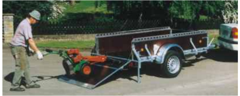
Ein leichtes Überfahren der Auffahr-/Laderampe ist durch unser Alu-Auffahrprofil auch mit kleinsten Rädern problemlos möglich.