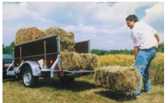
PK 751 in Ausführung mit vorderer Klappe. Serienmäßig: Spannseile an der Heckklappe, ohne Gurtleiste, da Zubehör: aufsteckbare Bordwandaufsätze 400 mm hoch.