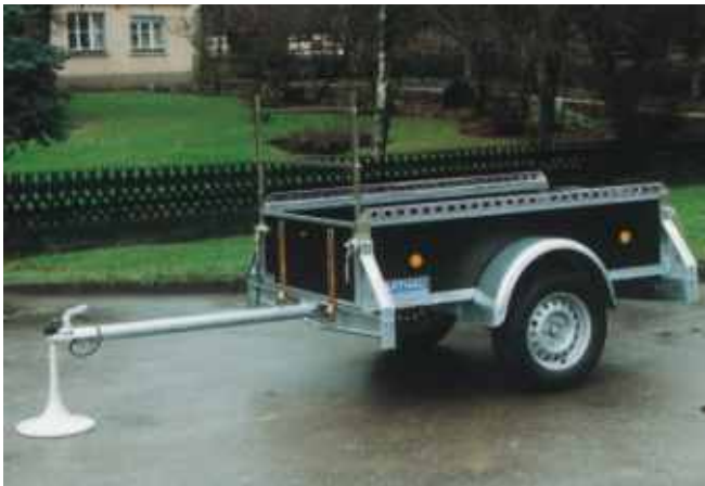
PK 751 mit Zubehör: H-Galerie, vordere Klappe mit um 50 cm ausziehbarer Zugdeichsel, Gurtleiste serienmäßig.